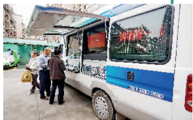
便民服务队进社区服务