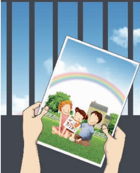
上城区检察院原创的廉政海报:铁窗中看全家福,阴暗深冷。形象地告诫相关人员为了过上和谐幸福的生活,要与职务犯罪划清界限。

● 业务精湛:两个预防点子“预防直通车”和“检察官点评岗位廉政风险点”,入选市检察院主办的廉政风险防控“十大金点子”