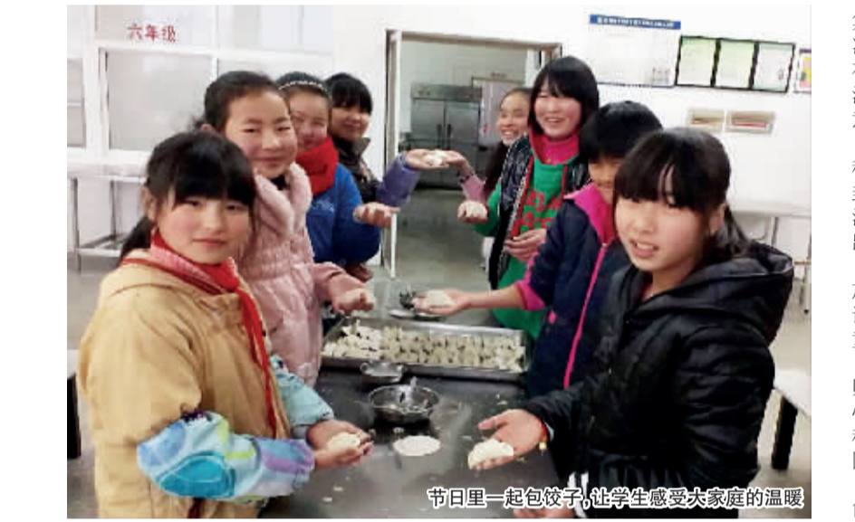
节日里一起包饺子,让学生感受大家庭的温暖

本报讯(通讯员 陈启浩 建德记者站 李杜娟)“贴心·安心·连心·谈心·塑心”,2013悄悄到来,留守儿童又成为学校和家长的关注焦点,建德市乾潭第二小学探索建构农村小学留守儿童“五心”教育模式,得到家长和社会的肯定。