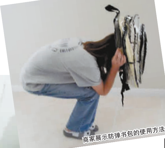
商家展示防弹书包的使用方法

在全国对禁枪与否的激烈争论中,美国总统奥巴马19日任命副总统拜登牵头研究控枪对策,后者预计明年1月提出建议,供奥巴马在国情咨文中阐述。