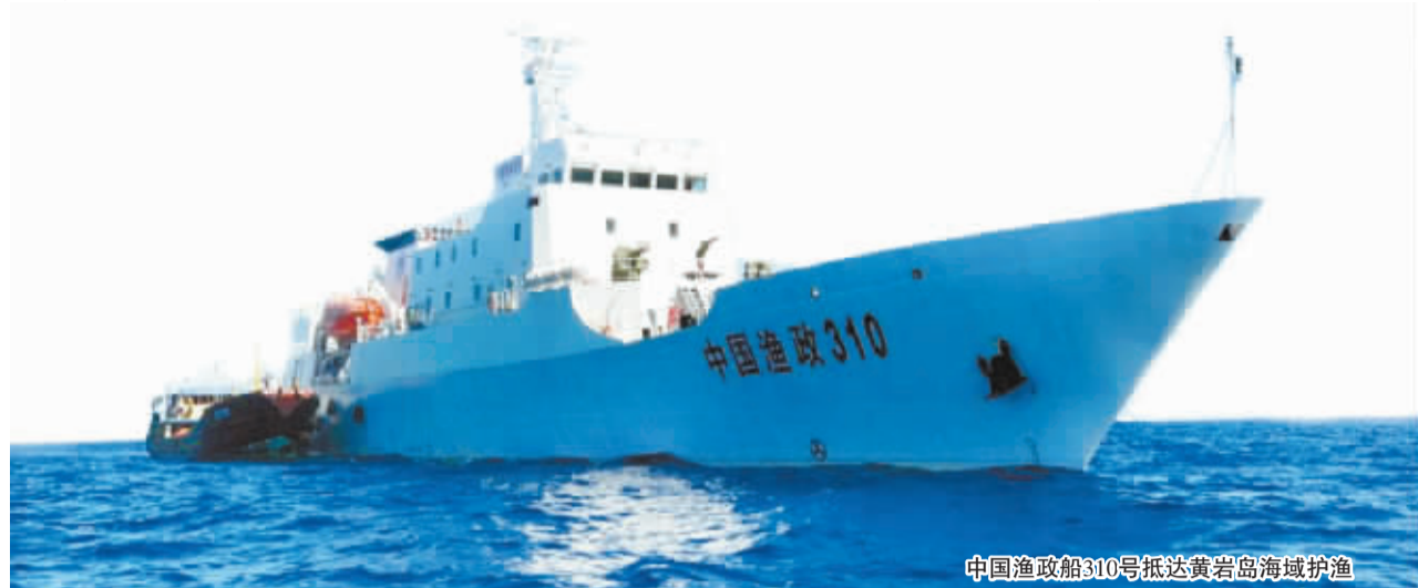
中国渔政船310号抵达黄岩岛海域护渔

“几年来,菲律宾有些战略误判。一是对美国所谓‘重返亚太’可能产生的战略效果产生误判,二是对《美菲共同防御条约》对菲律宾提供的所谓支撑产生误判,三是对其他东盟国家特别是在南海问题上有声索主张的某些国家是否会与菲律宾采取同步行动产生误判,四是对中国捍卫主权、领土完整和海洋权益的决心与意志产生误判。”中国国际问题研究所副所长董漫远说。(综合新华社、央视消息)