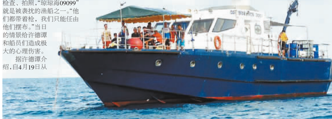
黄岩岛海域,中国渔船穿梭捕鱼