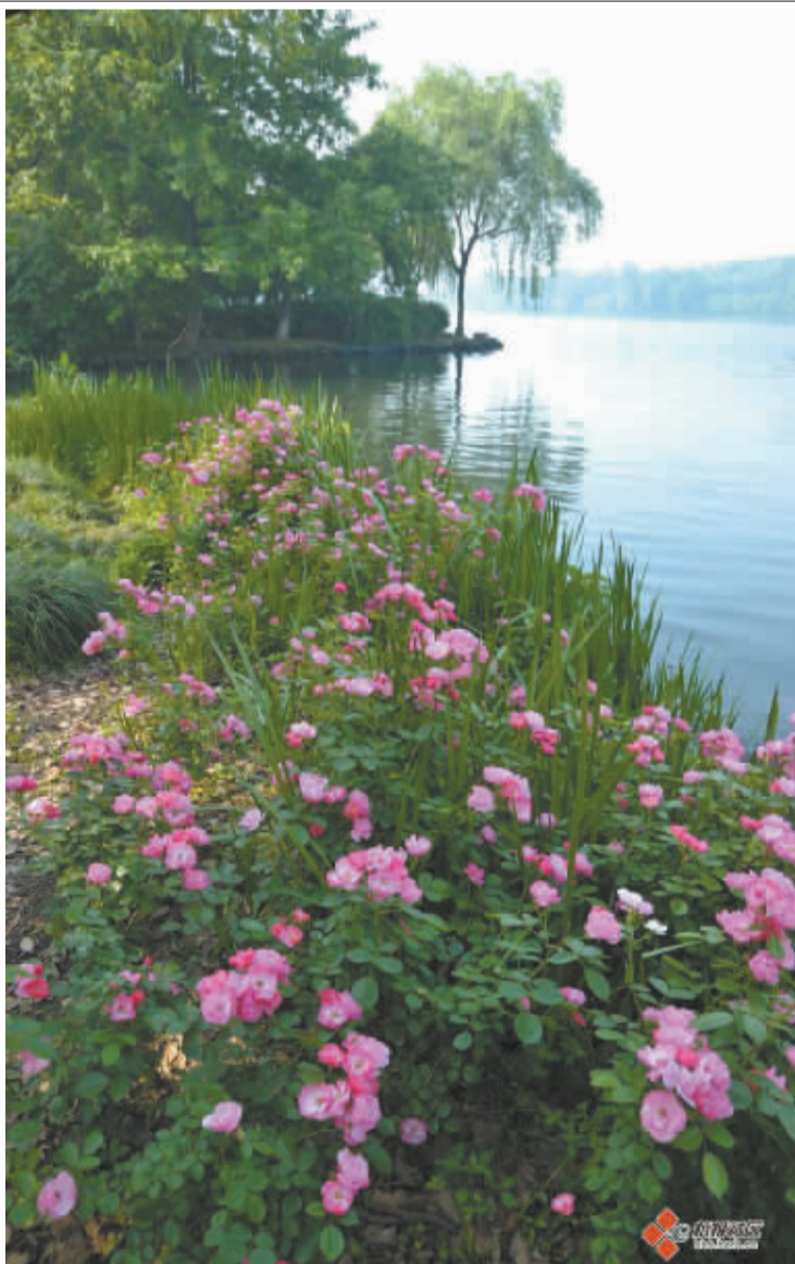
西湖拍不厌,换个角度就有不一样的美景。虽然立夏已过,西湖边依然像春天般的美丽。