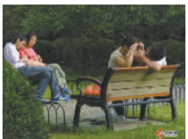
一对椅子二对情侣 山河之滨摄于涌金公园