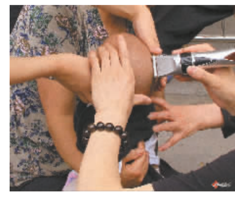
前天,小区里有一位才8个月大的小孩在理发,七八只手重点保护头部,确保理发万无一失。