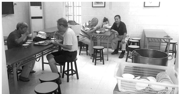
中午12点后,吃饭的老人逐渐散去。

吴科长说,承包方做了半年,就餐老人评价很高,但每个月都要贴钱,他们想增加销量来弥补差价,这就影响到排烟量了,排烟时间一加长,周边投诉就多了。