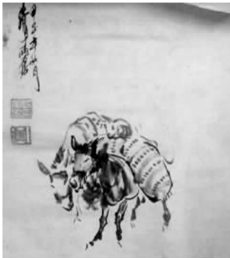
黄胄擅长人物画和动物画,涉案字画里画的是两头驴。落款为:甲子年秋月,黄胄于两石居。