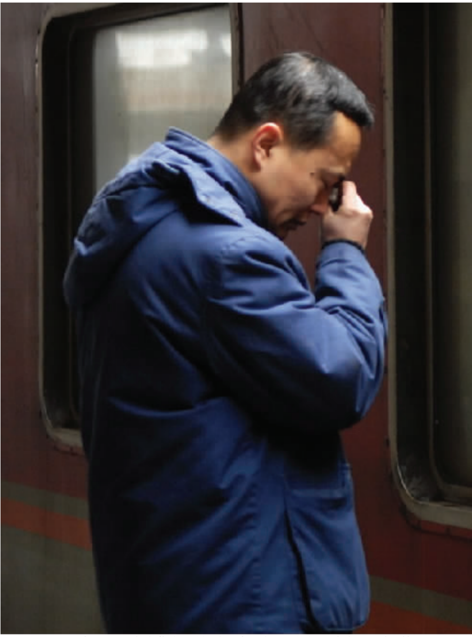
这张由新华社记者于2011年春节前夕拍摄的照片感动了许多人，一直在网上被热转。