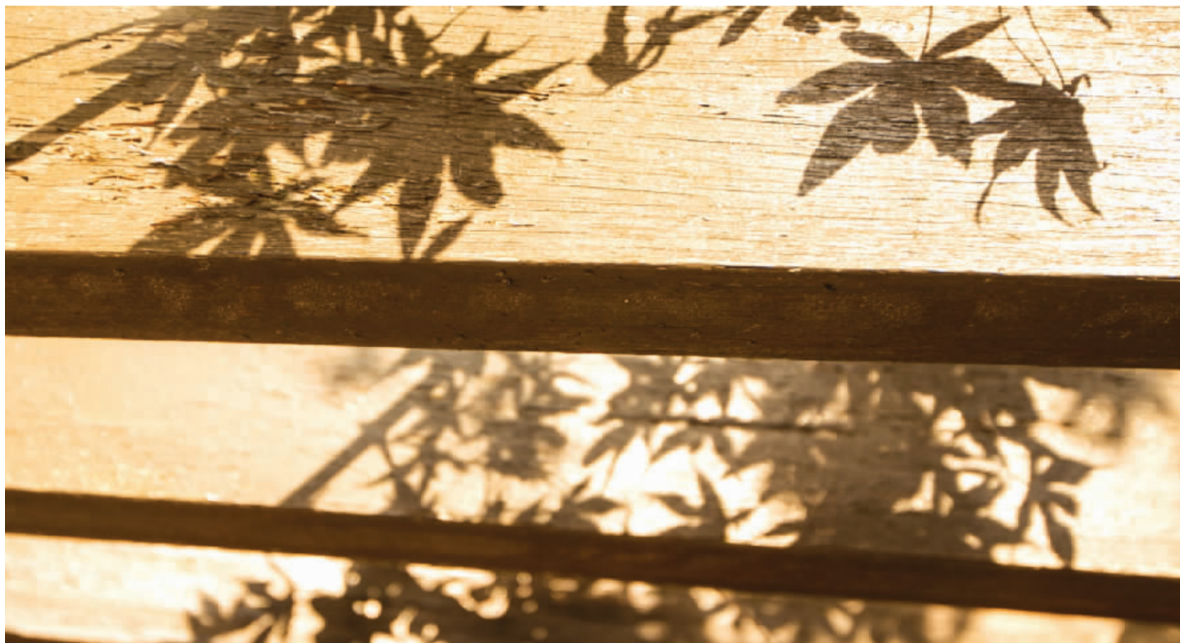
中河路，路边的树叶倒影在围栏上。