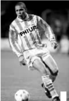
本报记者 李琛 综述

罗纳尔多是世界足坛继马拉多纳之后涌现出的最伟大的天才,在世纪之交他是当之无愧的新球王,而和其他“球王”最大的不同点就在于罗纳尔多的职业生涯极度坎坷,要命的伤病总是和他如影随形,但是罗纳尔多最伟大的地方就在于,“外星人”总是能够摆脱这些伤病的困扰,因为他有一颗“坚强的心”。