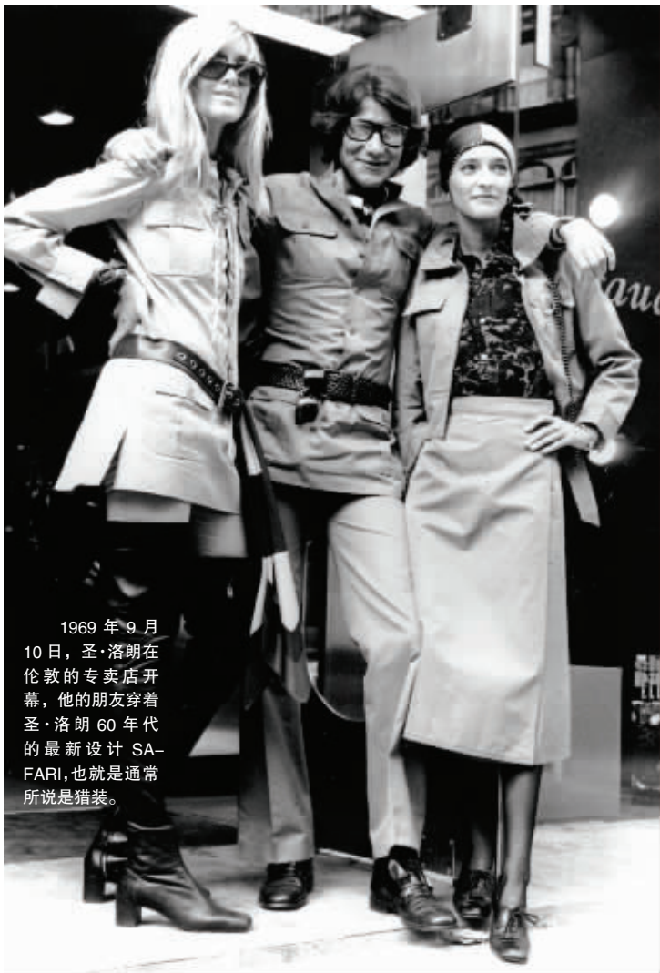
1969年9月10日，圣·洛朗在伦敦的专卖店开幕，他的朋友穿着圣·洛朗60年代的最新设计SA-FARI，也就是通常所说是猎装。