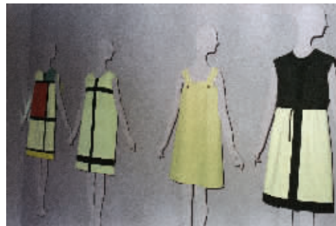
纽约大都会博物馆1983年举办YSL25年回顾展。1965年，Yves Saint Laurent创造了经典几何线条裙子，1966年，则推出了流行艺术系列。

6月1日，Yves Saint Laurent离开了，他71岁，时尚界失去了一个伟大的人物，永远无人可以取代。