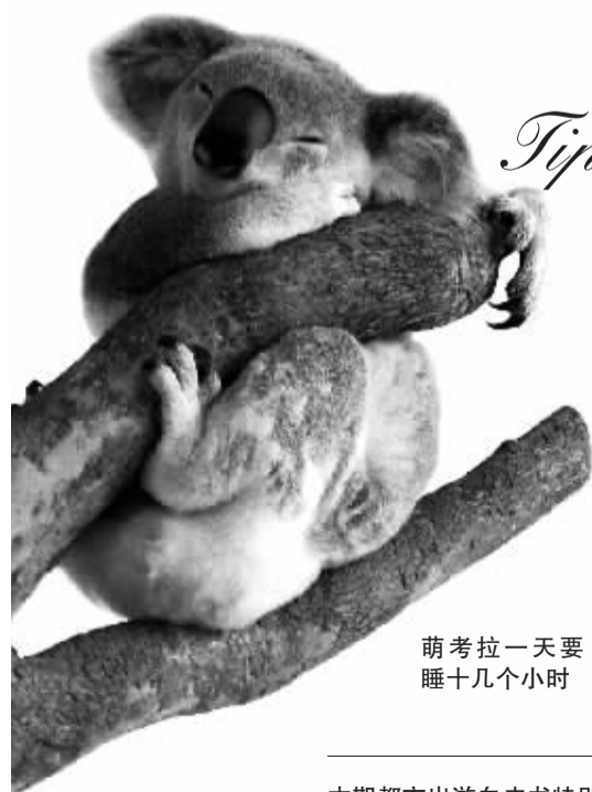
萌考拉一天要睡十几个小时

有些父母想去探望在澳洲留学的孩子考虑选择探亲签证,或者商务人士去工作选择商务签证,这都需要多交些材料。业内人士建议,其实还是个人旅游签证来得方便,而且不影响探亲和工作。办理个人旅游签证时间为 10 个工作日,可以交由旅行社代办,或者自己翻译好材料去上海领事馆送签。