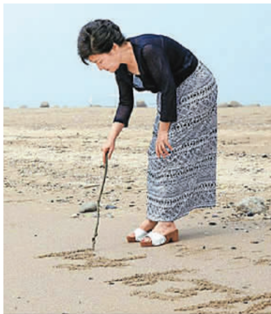
朴槿惠在沙滩上,写下“猪岛的回忆”。