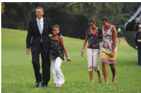
马萨葡萄园是奥巴马每年度假的必到之地

也有不少国家的领导人休假制度是后来建立起来的,比如俄罗斯。苏联解体后,俄罗斯议会通过《国家公务员法》,该法案规定,担任俄罗斯重要职务的政要每年享有35天的假期。总统还有“额外的国务工龄带薪假”,每一年工龄加一天假,但累计不得超过45天。俄总统、总理在休假期间还有可能拿到双薪,如果他们完全没有休完自己应有的休假天数,则有权得到“补偿金”或“累计假期”。俄总统、总理休假不休工,他们在休假期间还得举行一系列工作会见等。