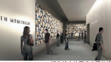
博物馆内的罹难者照片墙