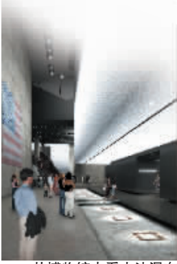
从博物馆内看水池瀑布