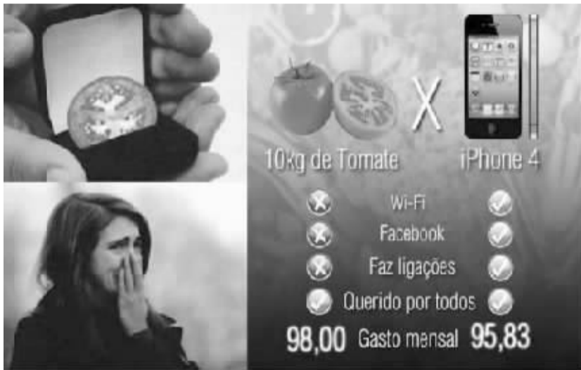
巴西网民恶搞西红柿:用西红柿代替钻戒求婚;每月买10公斤不能上网、不能打电话的西红柿,其花费比分期付款买iPhone4还贵。

对此,巴西央行无法坐视不管。该行在最近结束的政策会议后宣布,将国内基准利率上调25个基点至7.50%,这是2011年7月以来,巴西央行首度加息。同时也令该国成为全球主要央行中率先退出宽松政策的先锋队成员。