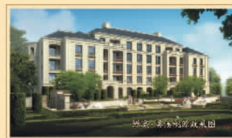
绿城·英溪桃源效果图

英溪桃源建筑风格，延续莫干山别墅群取法西方的传统，着力糅合西方建筑文明精华和江南清丽山水，营造人文主义诗意栖居。首发产品绿城平层官邸为绿城精研五年成熟大作，是借鉴欧洲文艺复兴时期帕拉迪奥建筑精神的典范之作，在设计中又融入法式宫廷的建筑理念，建筑仪式感深厚且丰润。以3至4层的建筑形制，200-300平方米平层空间，涵养别墅的功能品质。“十字形”的平面布局，将户内空间划分为四个功能区域，使礼仪区、社交区、家庭活动室与休息室等空间之间保持良好的独立性和连通性，塑造出古典的尊崇感与高贵气质。