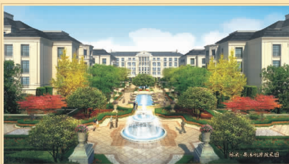
绿城·英溪桃源效果图

绿城·英溪桃源，莫干山脚下的第二个桃花源，结合天然原生态山水美景，规划独栋别墅、法式合院别墅、平层官邸、山景公寓、星级酒店等精品，通过建筑与环境的和谐交融，凭借“以人为本”的理念，强大的别墅园区规划和营造能力，以及对地域历史的研读，对人文风情的雕琢，为居住者规划的浪漫诗意的生活场景，历久而弥珍。