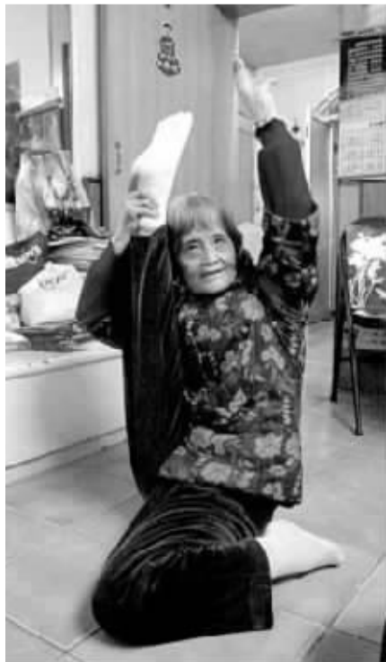
覃老太太给网友展示“高难度体操”。