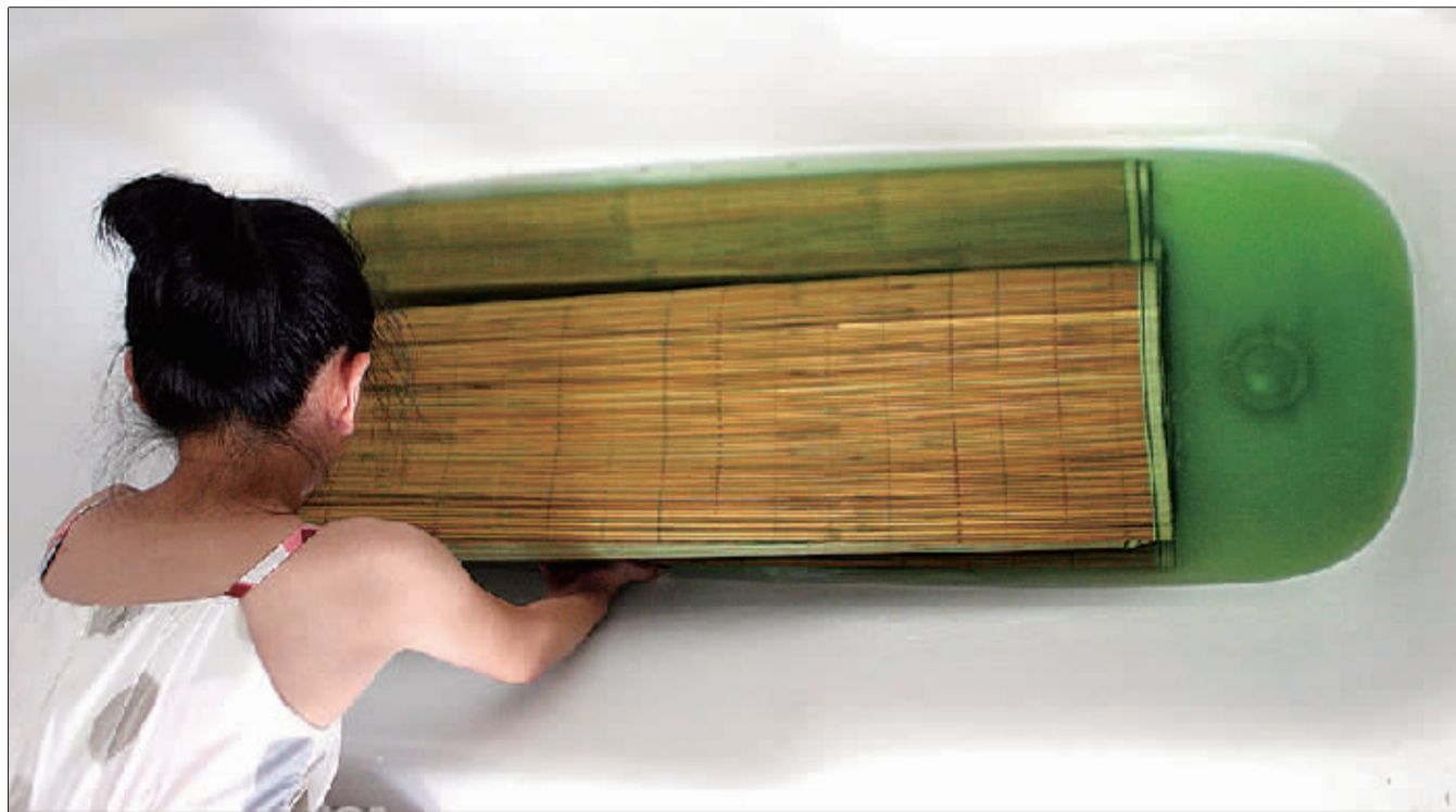
浸泡一个小时后,水变成青菜色,青竹席褪色成黄竹席。

我是化学老师。这些染色竹席在小商品市场里太多了。明天我带几个学生再去买几床回来,做一下实验,然后让他们写出环保方面的研究报告。