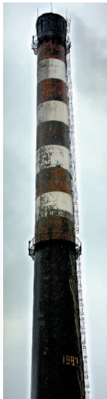
这根150米高的烟囱要保留