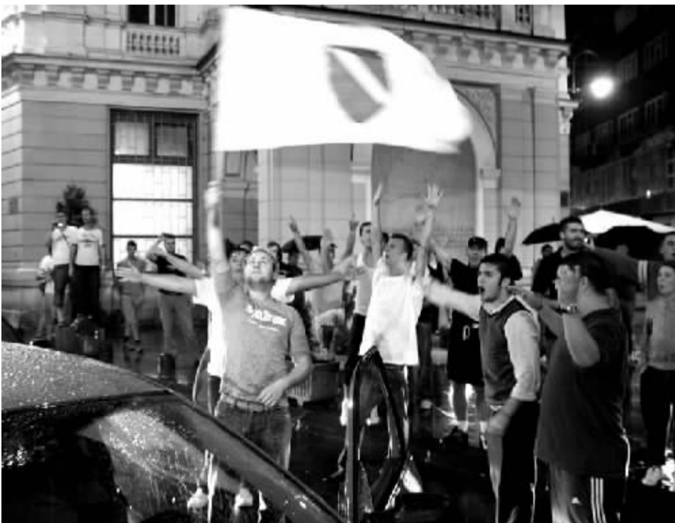
卡拉季奇的反对者21日涌上街头狂欢

6. 在许多例证中,那些被逮捕的妇女和女孩在军营遭到强奸,或者被从拘押中心带走,然后再遭受强奸或者性虐待。被关押者每天只有很少食物,经常要处于挨饿状态,他们的医疗条件也很恶劣。