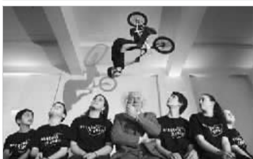
玩小轮自行车的“最高境界”