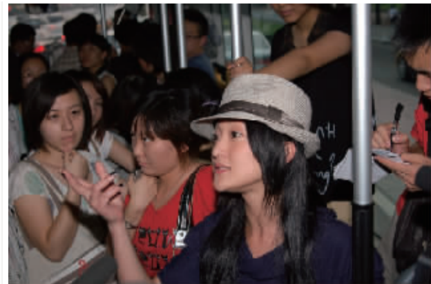
主角：周迅 坐公交车宣传环保

周迅自从成为联合国开发计划署的中国亲善大使后，就处处宣传环保。7月10日下午，周迅来到位于北京潘家园附近802路公交车总站。10年没坐过公交车的周迅在上车后非常兴奋，提倡大家尽量多搭乘公共交通，这样可以减少汽车尾气的排放，为北京能够有更多的蓝天做出自己的一份贡献。