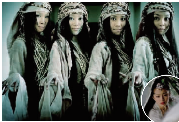
主角：《画皮》中的女妖 从幽深江南 到现代新魔幻

已身为母亲的丹妮斯·理查兹曾是令无数男性观众热血沸腾的“邦女郎”，尽管现已沦落至三线女演员，但一直在为挽回人气而努力：上《花花公子》，闹离婚，争夺女儿抚养权……近日更是在录制自己主持的真人秀节目时出卖自己最大的本钱——身体——时而玉背全裸，时而比基尼出镜，最后还在沙滩上上演了一出露点泄春光的大戏。