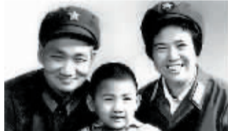
毛岸青、邵华及毛新宇全家合影